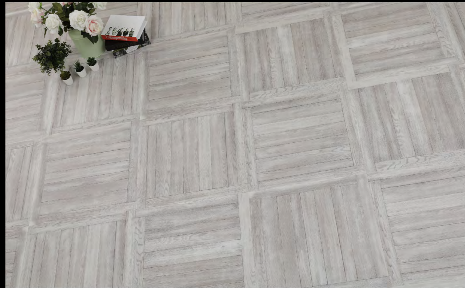
ABC - 6601