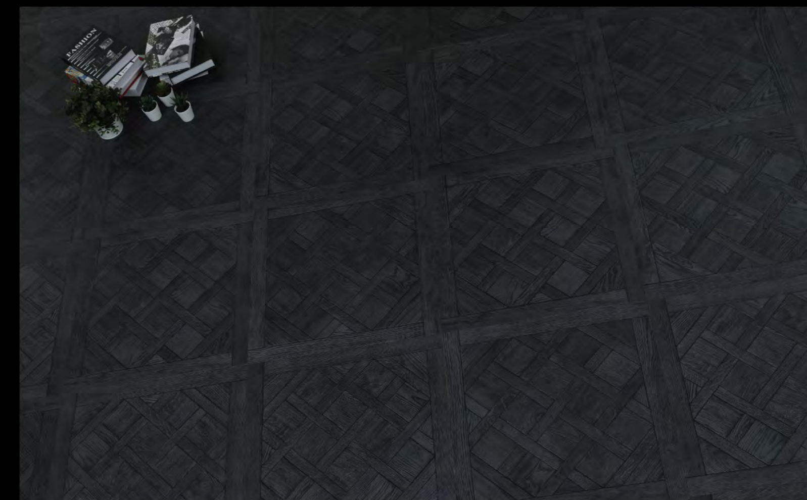
ABC - 6606