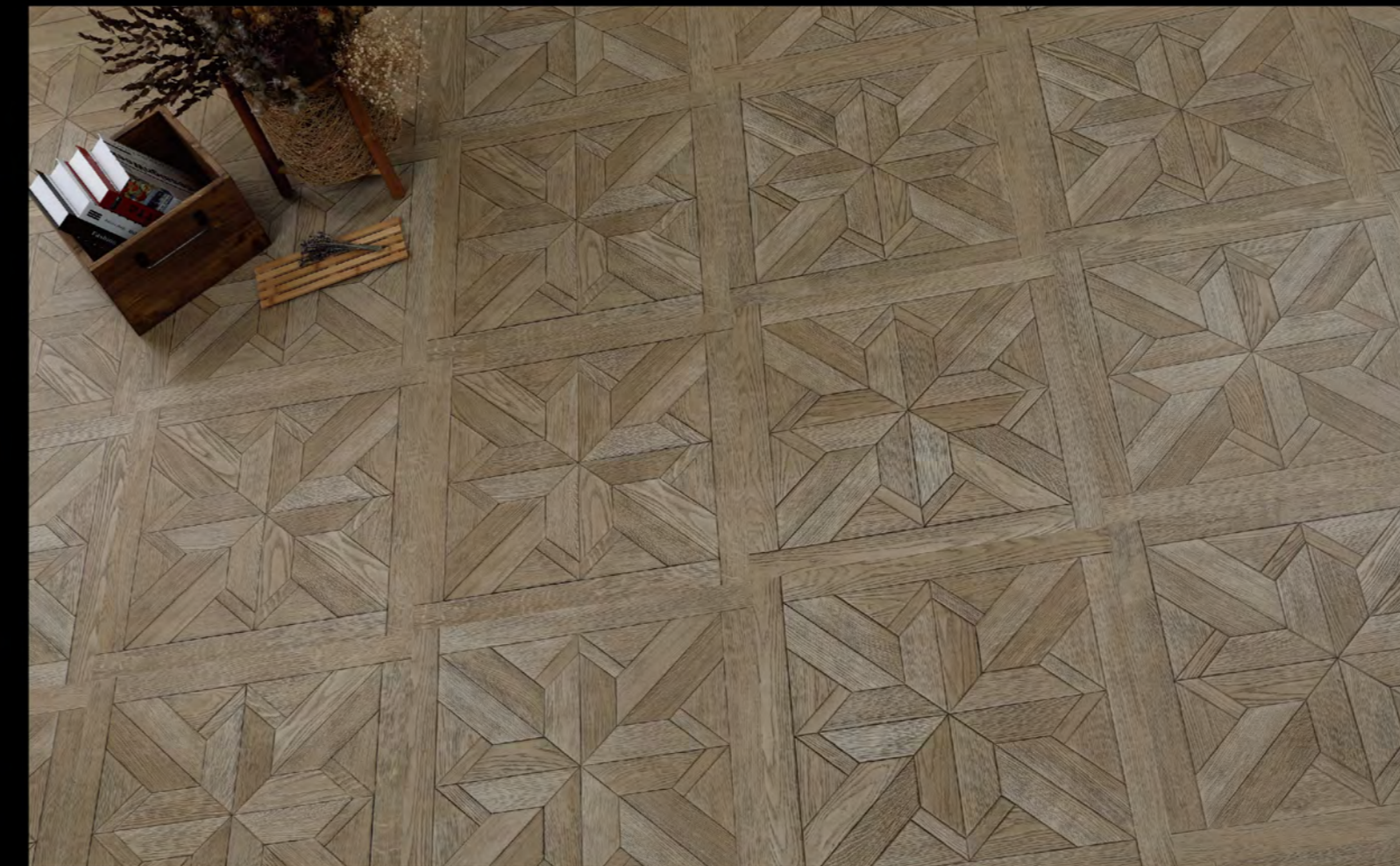
ABC - 6603