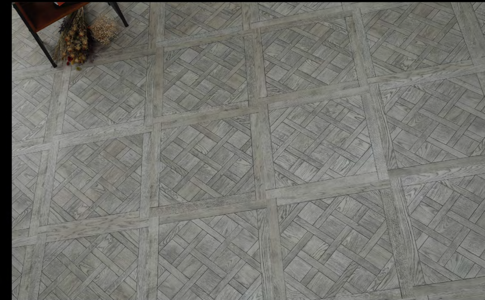
ABC - 6605