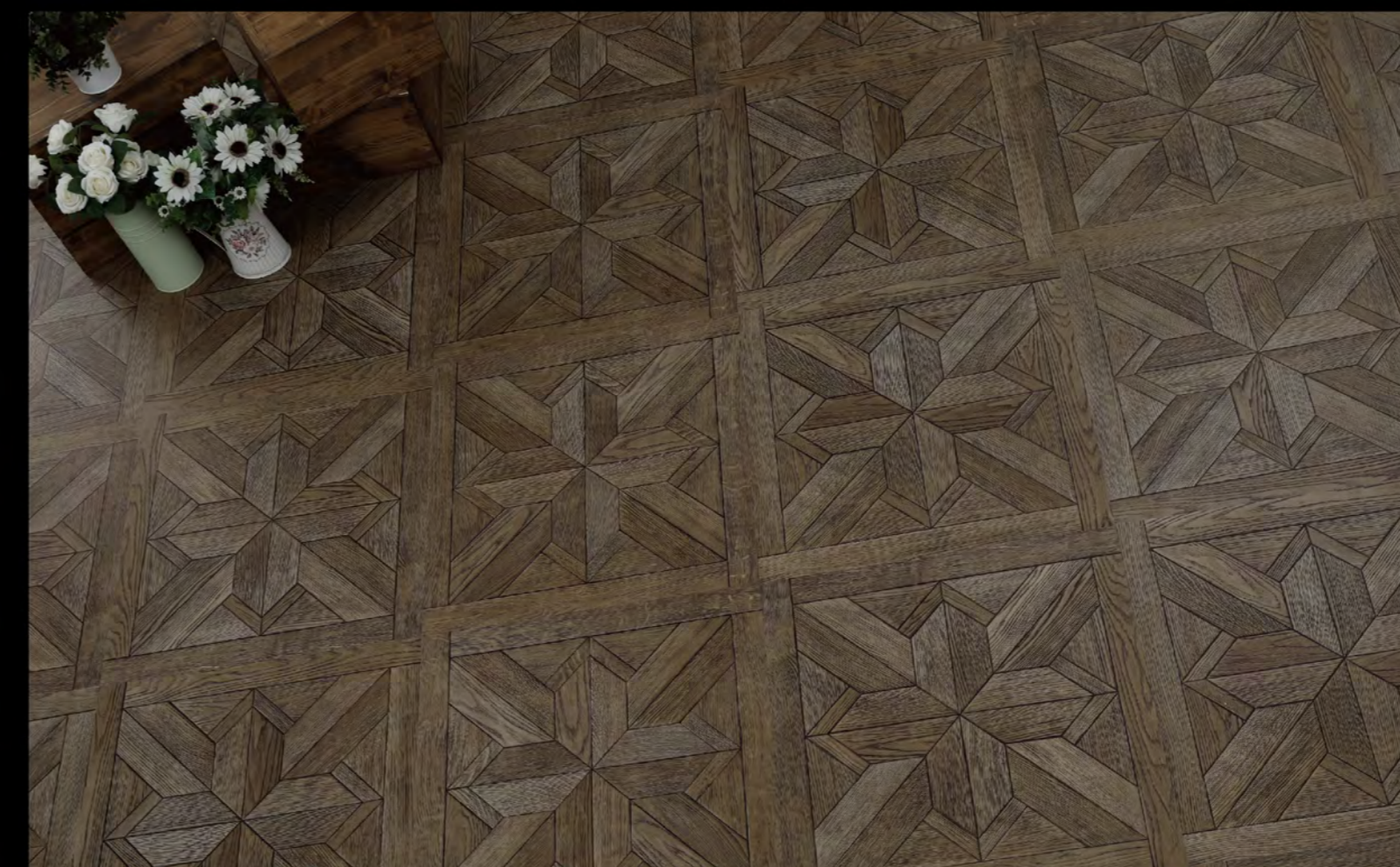
ABC - 6604