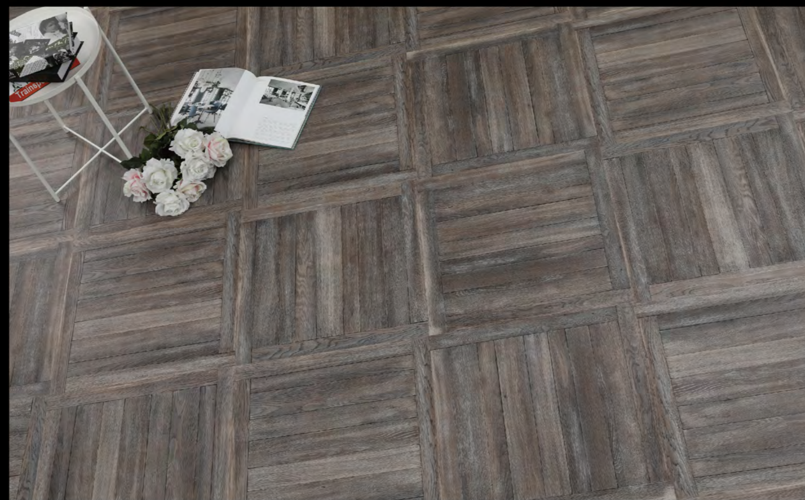
ABC - 6602